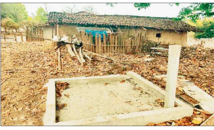
घरों में लगाए गए नल कनेक्शन।

जनपद पंचायत शंकरगढ़ अंतर्गत ग्राम पंचायतों में वर्ष 2021-22 के दौरान जल जीवन मिशन के तहत निर्माण कार्य प्रारंभ हुआ। हैरानी की बात तो यह है कि चार वर्ष बीत जाने के बाद भी न तो कार्य पूर्ण रूप से संपन्न हुआ और न ही निर्णयित जलापूर्ति शुरू हो सकी है। जगह-जगह पानी टंकीयों बनकर तैयार हैं, लेकिन उनमें पानी नहीं भरा जाता। पाइप लाइन बिछी हैं, परंतु उनमें कभी पानी प्रवाहित नहीं हुआ। जनपद पंचायत शंकरगढ़ अंतर्गत आने