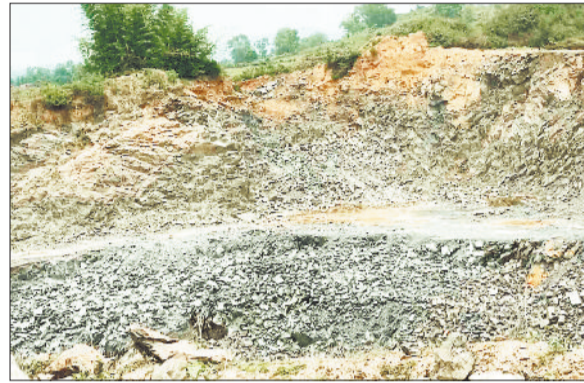
पत्थर निकालने के लिए खेत में खोदा गया गड्ढा।