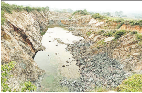
किसानों के खेतों में बना खतरनाक गड्ढा।

विकासखण्ड लुण्डा अंतर्गत ग्राम पंचायत चंदेश्वरपुर, चंगेरी एवं करी में वर्षों से डेढ़ दर्जन से अधिक क्रशर संचालित हो रहे हैं। प्रशासन द्वारा क्रशर संचालकों को पत्थर उत्खनन के लिए पहाड़ आवंटित किए गए हैं। क्रशर संचालक लगातार विस्फोट कर पहाड़ों का पत्थर तो उत्खनन कर ही रहे हैं अधिक कमाई की लालच में खेती की जमीनें भी सुरक्षित नहीं बची हैं। क्रशर संचालकों ने आदिवासी परिवारों के गुजर-बसर के लिए प्रदान किए गए पट्टे की भूमि को भी पत्थर उत्खनन कर सुरंग बना दिया है। प्रभावशाली क्रशर संचालकों ने पहले शासकीय भूखण्डों से बेतरतीब अवैध उत्खनन कर सुरंग बनाया तथा अब लम्बे समय से आदिवासी परिवारों के पट्टे की भूमि