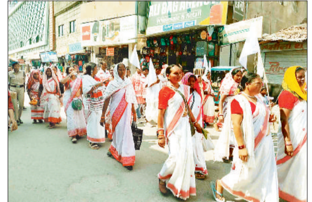
शोभायात्रा में शामिल समाज की महिलाएं।